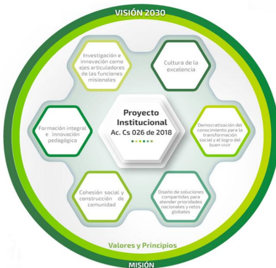
Figura 1. Estructura del Proyecto Institucional. Universidad Industrial de Santander - UIS (2018) Acuerdo del Consejo Superior N.º 26 de 2018.